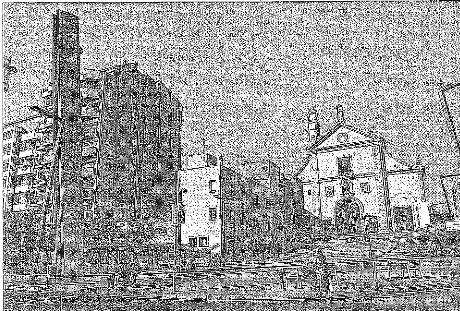
▶▶ Vista des de la plaça de Lesseps de l'església dels Josepets i els edificis veïns.

INICIATIVA URBANÍSTICA DE VEÏNS I COMERCIANTS A SARRIÀ-SANT GERVAZI